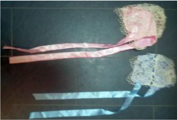
Babadogtertjies dra 'n pienk kappie en seuntjies 'n blou kappie