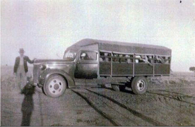
Die skoolbus waarmee al die Henning kinders na die skool op Schweizer-Reneke vervoer is. Mens kan jou indink wat se katekwaad op so 'n bus plaasgevind het

Barend Henning sterf op 30 Maart 1951 en is in die plaasbegravingplaas op Boomplaas, Schweizer-Reneke begrawe.