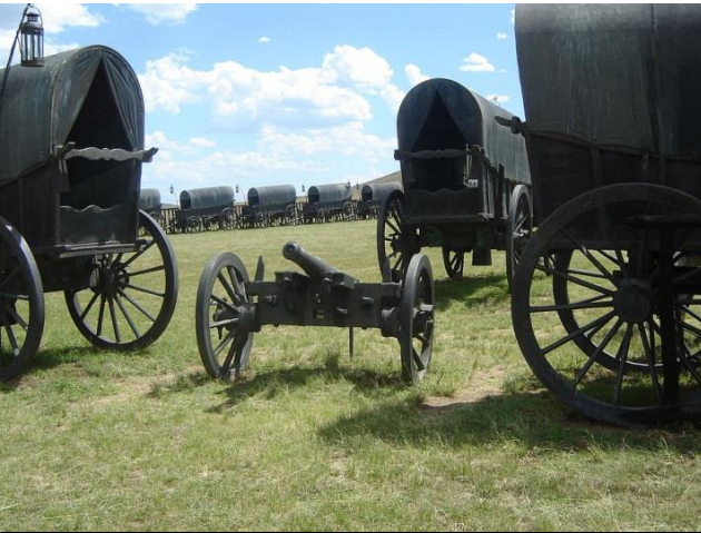
Die gerekonstrueerde Boerelaer, van brons yster gemaak, wat gedurende 1971 op die terrein van die Slag van Bloedrivier opgerig is

VoortrekkerArgiefstukke gepubliseer 1937 en Bloedrivierse Eeufees Gedenkboek - geen jaartal word vermeld nie, maar was dit stellig 1938?