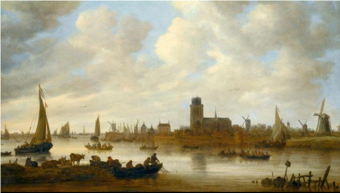
Ets deur Renier Nooms van die uittoeg met platboomskuite vanaf Oostindisch Huis na die eiland Texel, van waar af alle skepe vertrek het