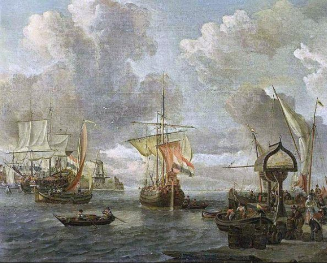
'n Skildery van Abraham Storck met 'n uitsig oor die hawe op die eiland Texal aan die Suidersee, van waar af alle VOC skepe vertrek het omdat die Suidersee self te vlak was

groter) het die meeste daarheen gegaan. Meestal moes hulle oorbly in die stegies in agterkamers of solders waar die straatvroue bedrywig was. Op bepaalde dae is ‘ volgens gewoonte ’ in alle strate en stege met trommels en fluite, skalmeie en trompette aangekondig dat nuwe werkers by die kompanje benodig word. Die kantore was geleë te Oostindisch Huis, 'n reeks van geboue in Oude Hoogstraat vanaf die Dam na die Oude Schans waar die stadsmuur van die Middeleeuse stad was. Tans word die oorspronklike hoofgebou deur die Sociologisch Instituut van die Universiteit van Amsterdam gebruik.