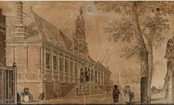
'n Tweede skildery van Het Oostindisch huis te Enkhuizen , die hoofkwartier van die kamer Enkhuizen. Dit toon die gebou net van die ander kant af as die skildery op die voorblad