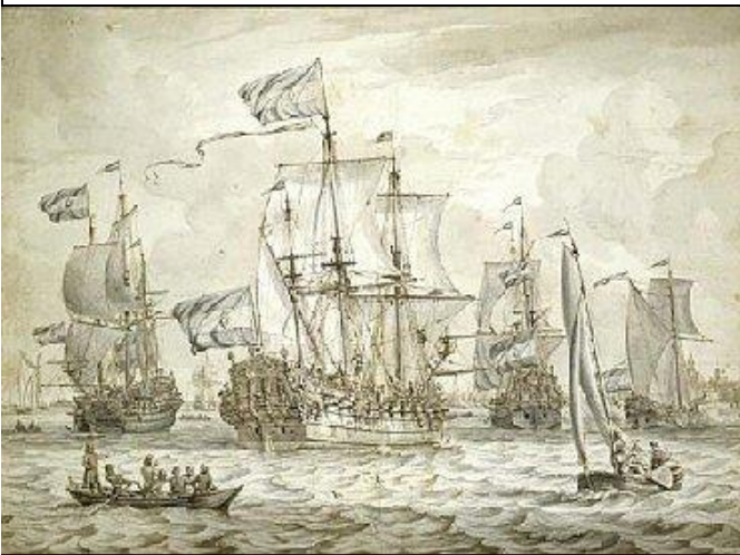
'n Vloot skepe maak gereed om vanaf die eiland Texel uit vaar na Batavia